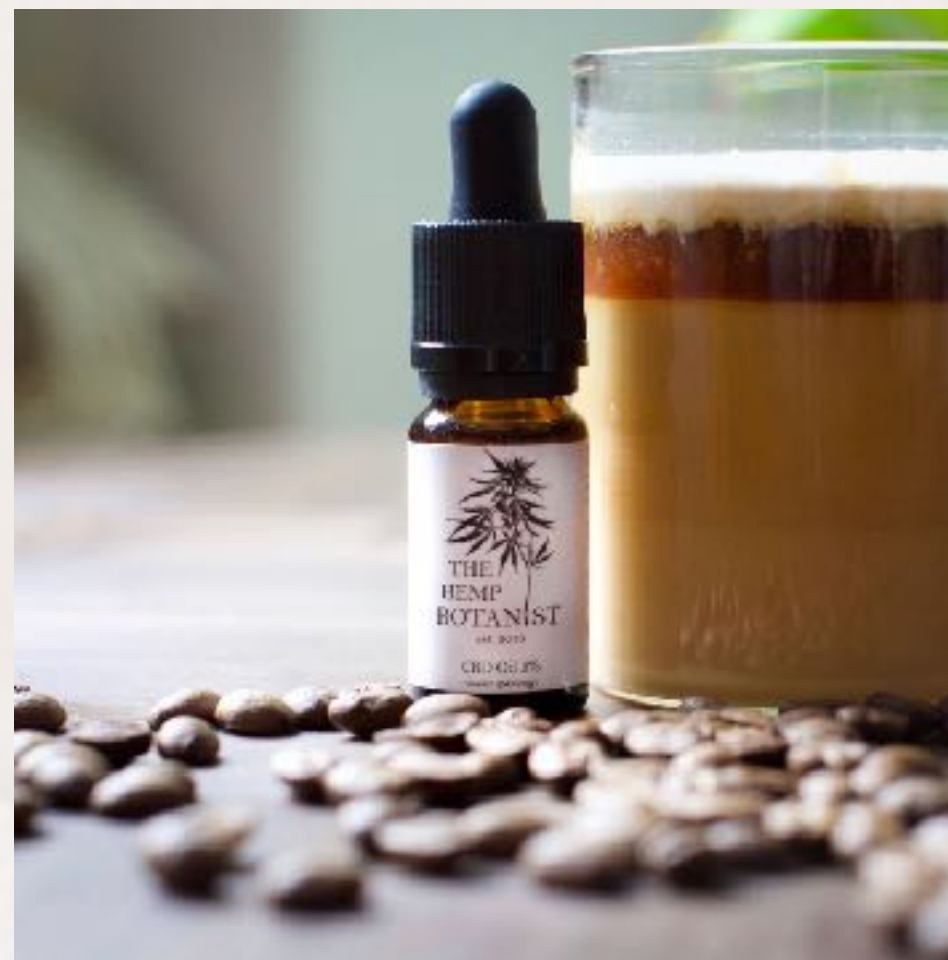
Eksempel på Luluna produkt-fotografi.

Hvis du som partner har lyst, vil vi meget gerne også lave en blog-post omkring dig eller din virksomhed/kreativitet. Sig gerne til, hvis det kunne have interesse. Vi har ikke lavet partnerkontrakter endnu, da konceptet stadig er nyt og casual men det kan være det kommer på et tidspunkt. I den vil det fremgå hvordan aftalen om Slow Stock er, mere på næste slide :-)